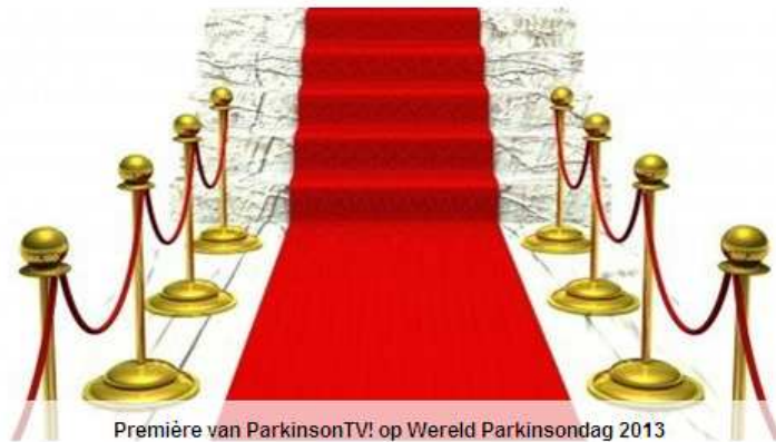
Première van ParkinsonTV! op Wereld Parkinsondag 2013

Home ParkinsonNet Parkinson Scholingen Kwaliteitsbeleid Nieuws Media FAQ Contact Voorwaarden