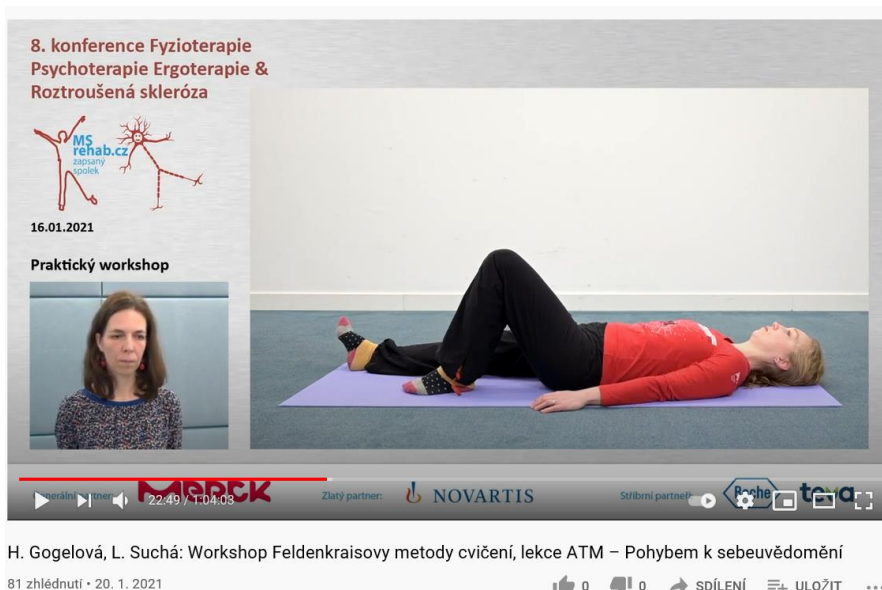
Obr.3-Workshop cvičení Feldenkraisovy metody

Navzdory náročné epidemiologické situaci se i letošní konference velmi vydařila.