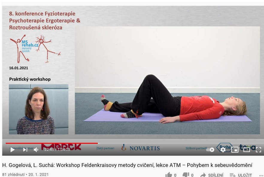
Obr.3-Workshop cvičení Feldenkraisovy metody

Navzdory náročné epidemiologické situaci se i letošní konference velmi vydařila.